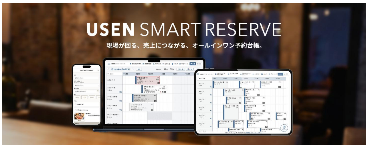
『USEN SMART RESERVE』サービスサイト

『USEN SMART RESERVE』はウォークイン来店や早期退店による空席情報を各種予約サイトへリアルタイムに反映させ、お店の稼働率と売上の最大化を支援する予約台帳です。さらに、業界最低水準の手数料で利用できるオンライン決済を標準装備し、事前決済対応による無断キャンセル（ノーショー）対策としても活用できます。飲食店向け高機能POS『USEN レジ』と連携することで、予約から会計までの情報を一気通貫でつなぎ、接客の質向上と店舗収益の最大化に寄与します。